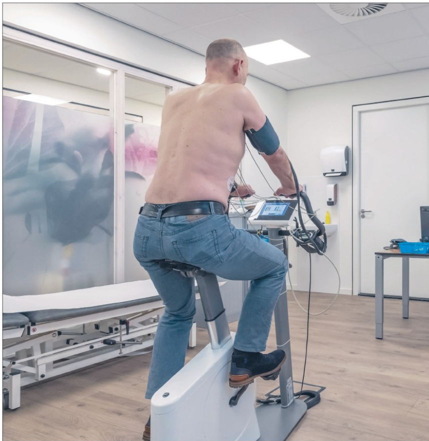
Voor een fietstest, hartfilmpje en echo hoeven patiënten niet naar Zuyderland ziekenhuis. Hiervoor kunnen ze ook bij PlusPunt terecht.

TEKST: JUDITH HOUBEN